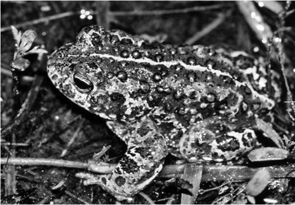
Abb. 1: Charakteristisch für die Kreuzkröte sind die kurzen Hinterbeine und ihre mäuseartige Fortbewegung sowie die auffällige helle Rückenlinie.

Von Lena DIENSTBIER und Burkhard BEINLICH