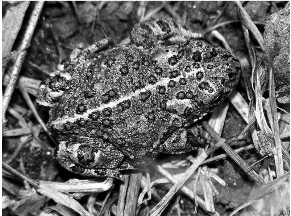
Abb. 5: Junge Kreuzkröte mit der typischen Rückenzeichnung