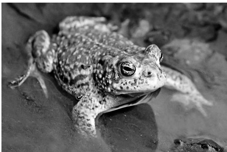
Abb. 3: Kreuzkröte (Foto: F. GRAWE)

Es kommt immer wieder vor, dass die kleineren Laichgewässer bereits vor Beendigung der Entwicklungsphase der Larven austrocknen. Größere Larven können kurze Trockenphasen im Schlamm des Laichgewässers überleben. Die kleineren, verendeten Larven dienen, nach Wiedervernässung der Senken, den in einer späteren Laichphase aus den Eiern schlüpfenden Larven als willkommene Nahrung, denn die Larven fressen in den relativ nährstoffarmen Gewässern alles Organische, das sie finden können.