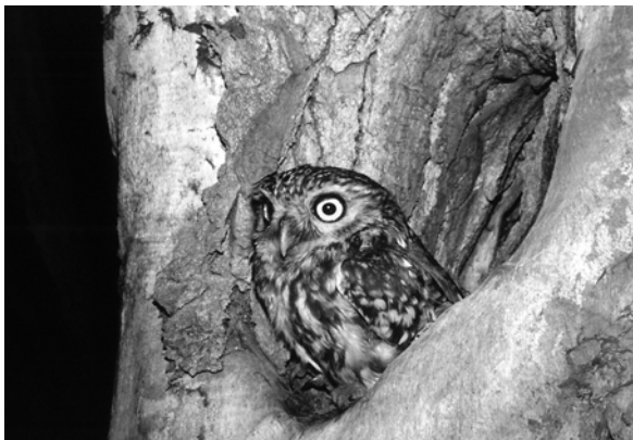
Abb. 3: Steinkauz

Weitere Ausführungen zu den Themen Gefährdung und Schutzmaßnahmen finden sich bei SINGER (2009) und HACKMANN (2011, in diesem Heft).