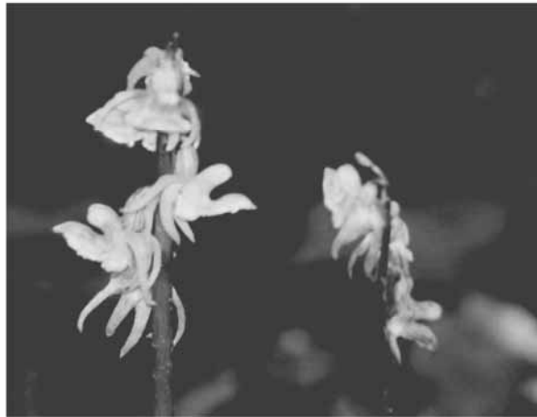
Abb. 2-5: Blattloser Widerbart ( Epipogium aphyllum ) im Weserbergland 2011

Anschrift des Verfassers: Wilfried STICHT Ludwigstr. 68 33098 Paderborn naturkundemuseum@paderborn.de